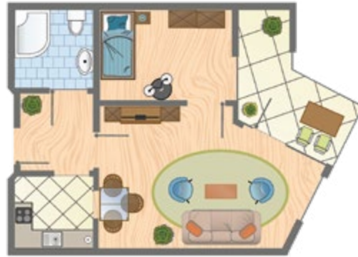
Apartment Typ B, ca. 38 qm Wohnfläche