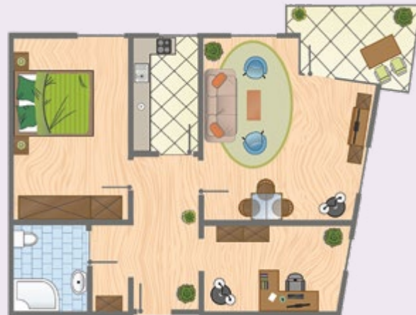
Apartment Typ G1, ca. 66 qm Wohnfläche