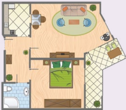
Apartment Typ F, ca. 57 qm Wohnfläche