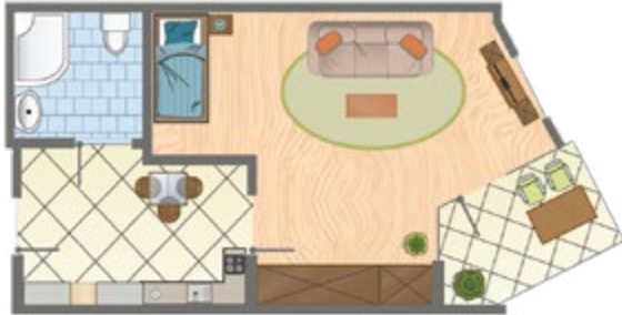
Apartment Typ A, ca. 33 qm Wohnfläche